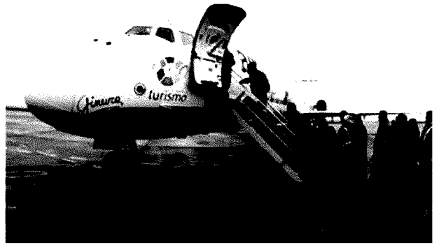
I passeggeri del volo inaugurale Brescia-Roma si imbarcano su Boeing Md 82 di Air Bee